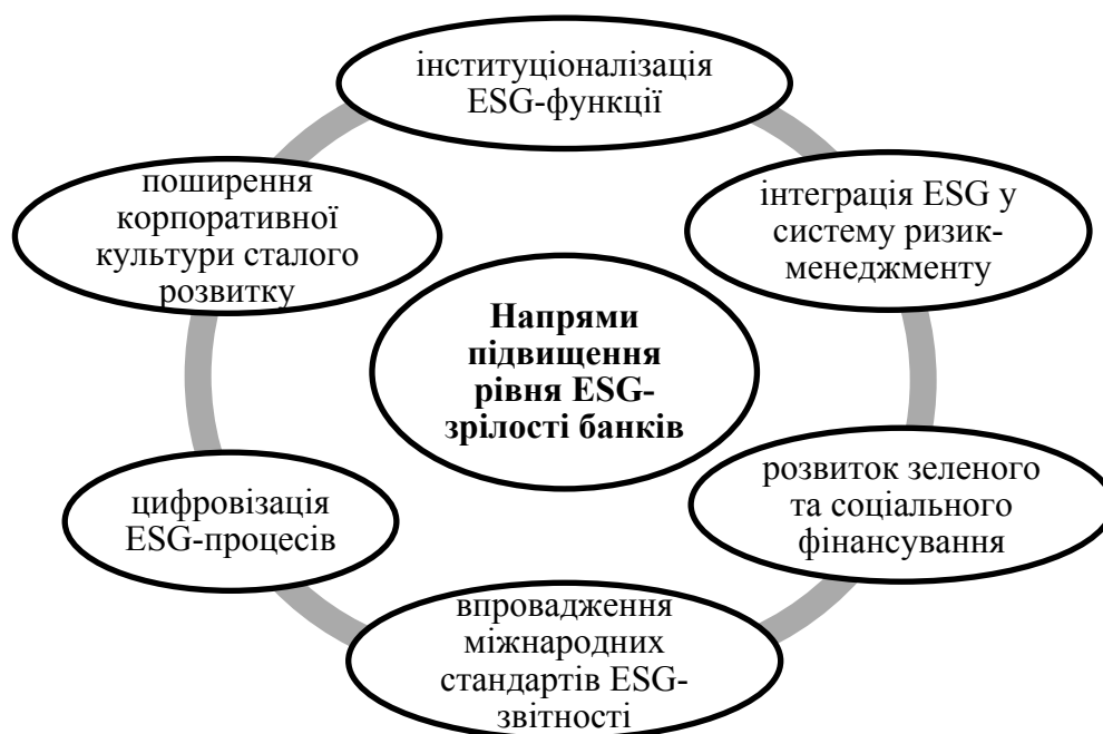
Рис. 2. Напрями підвищення рівня ESG-зрілості банків