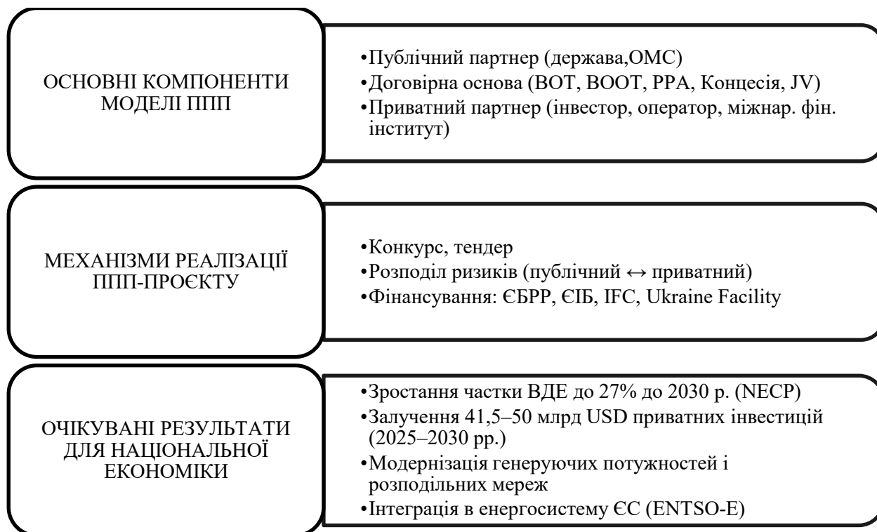
Рис. 1. Концептуальна модель ППП в енергетичному секторі України

У теорії розрізняють широкий і вузький підходи до визначення ППП. У широкому сенсі воно охоплює будь-яку форму залучення приватного капіталу до надання публічних послуг, у вузькому – лише договірні форми з формалізованим розподілом ризиків. Для цілей цього дослідження застосовується широкий підхід, що дає змогу охопити весь спектр механізмів, актуальних для енергетичного сектору. Концептуальну модель ППП в енергетиці представлено на рис. 1.