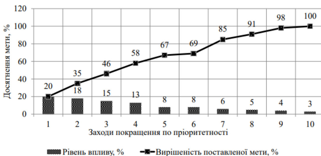
Рис. 2. Діаграма Парето з групуванням стратегії методом – ABC

Для встановлення пріоритетності та подальшого алгоритму запровадження заходів стратегії було побудовано діаграму Парето на основі проведеного аналізу тарифних та нетарифних регуляторів у попередніх розділах (рис. 2).