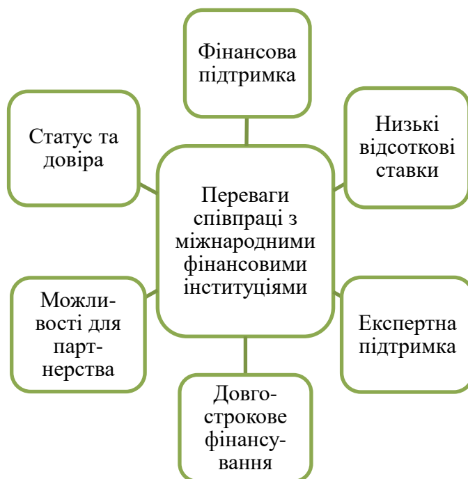
Рис. 4. Переваги співпраці з міжнародними фінансовими інституціями

Міжнародні фінансові інституції надають доступ до значних фінансових ресурсів, які можуть бути використані для фінансування проекту. Фінансування від міжнародних фінансових інституцій часто надається за низькими відсотковими ставками, що дозволяє знизити витрати на погашення позики. Міжнародні фінансові інституції надають кошти в довгострокове користування, що дозволяє проектам планувати свою діяльність на довгострокову перспективу. Такі інституції надають експертну підтримку у розробці та впровадженні проекту, що допомагає забезпечити його успішну реалізацію. Отримання фінансування від міжнародних фінансових інституцій підвищує статус проекту та забезпечує додаткову довіру партнерів. Співпраця з міжнародними фінансовими інституціями може відкрити можливості для партнерства з іншими організаціями та компаніями, що сприяє розвитку проекту. Такі