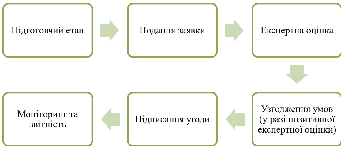
Рис. 3. Етапи процесу отримання фінансування від міжнародних фінансових інституцій