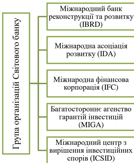
Рис. 2. Група організацій Світового банку

З 1947 року Світовий банк профінансував понад 12 000 проектів розвитку за допомогою традиційних позик, безвідсоткових кредитів і грантів. Міжнародний банк реконструкції та розвитку забезпечує фінансовий розвиток і фінансування політики, Міжнародна асоціація розвитку надає позики та гранти під нульовий або низький відсоток, Міжнародна фінансова корпорація мобілізує інвестиції приватного сектора та надає консультації, Багатостороннє агенство гарантій інвестицій забезпечує страхування політичних ризиків (гарантії), Міжнародний центр з вирішення інвестиційних спорів вирішує інвестиційні спори.