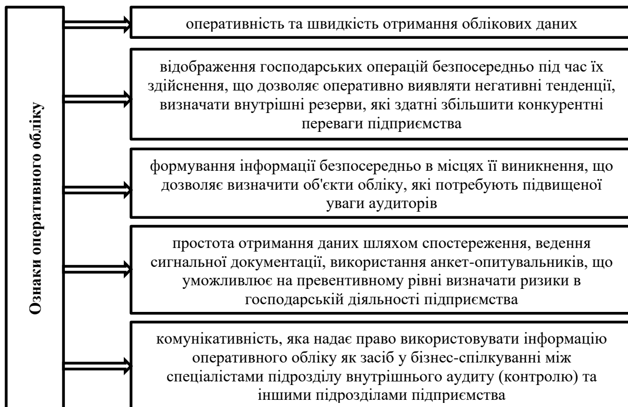
Рис. 1. Ознаки оперативного обліку як складової облікових процесів на підприємстві

В основі облікових процесів є елементи методу бухгалтерського обліку, сутність яких розглянута у табл. 2.