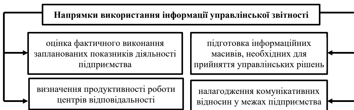
Рис. 3. Напрямки використання інформації, яка міститься в управлінській звітності, при управлінні діяльністю підприємства

Складання річних форм звітності, зокрема (рис. 4), які є невід'ємною складовою фінансової, податкової і статистичної, обліково-звітних процесів підприємства. передбачає проведення підготовчих робіт