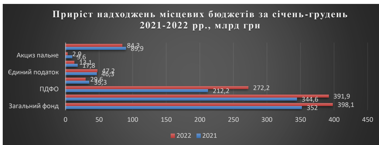
Рис. 2. Приріст надходжень місцевих бюджетів за січень-грудень 2021-2022 рр., млрд грн.