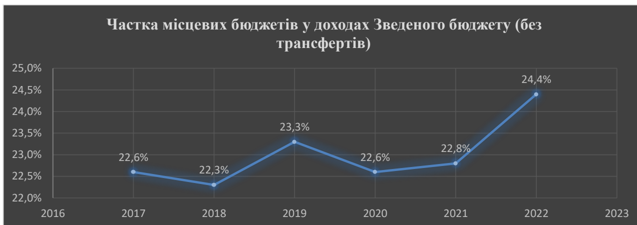
Рис. 4. Частка місцевих бюджетів у доходах Зведеного бюджету (без трансфертів)

грн, і відповідно становлять 24,7% від загального обсягу доходів. Частка місцевих бюджетів у доходах зведеного бюджету без врахування трансфертів зображена на рисунку 4.