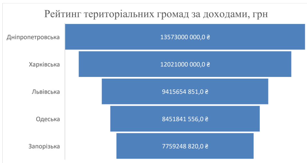
Рис. 6. Рейтинг територіальних громад за доходами

906,1 млн гривень. Не забезпечено приросту доходів по 5-ти областях – Луганській (-74,4%), Херсонській (-58,3%), Донецькій (-24,3%), Запорізькій (-23,6%), Харківській (-1,3%). Власне, через активні воєнні дії. Проаналізуємо стан бюджетів територіальних громад України станом на 2022 рік у деяких областях та розглянемо рейтинг громад за доходами та видатками.