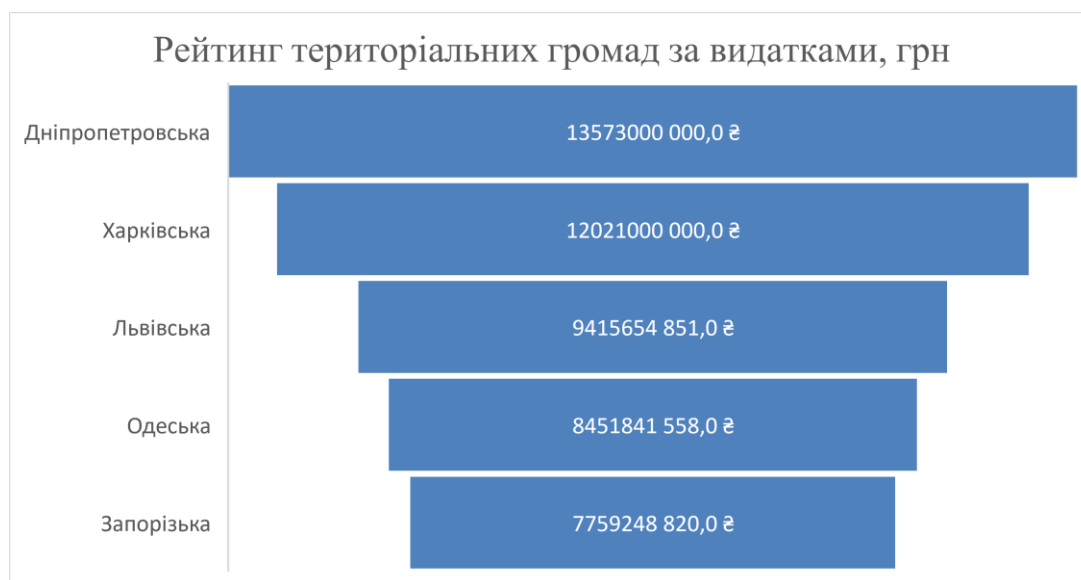
Рис. 7. Рейтинг територіальних громад за видатками