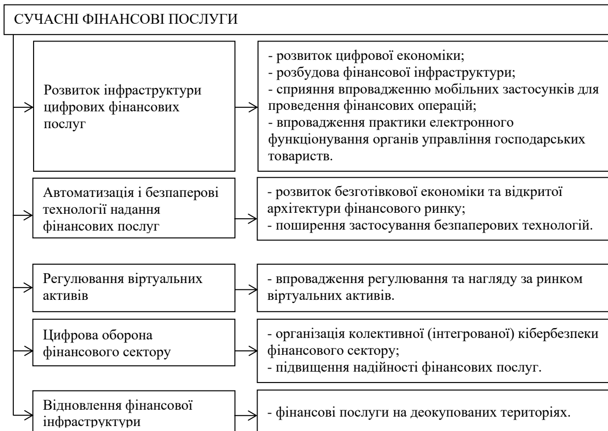
Рис. 2. Декомпозиція стратегічної цілі розвитку фінансового сектору України «Сучасні фінансові послуги»

Розширення використання потенціалу сучасних інформаційних технологій повинно також сприяти підвищенню рівня інформаційної прозорості фінансових установ, покращенню якості інформації про учасників ринку фінансових послуг [16, с. 415]. Підвищення прозорості роботи фінансових установ сприятиме зростанню довіри між споживачами та надавачами фінансових послуг.