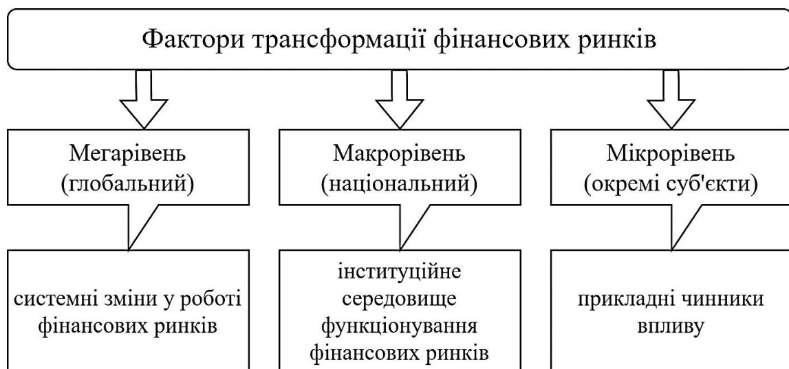
Рис. 2. Рівні факторів трансформації фінансових ринків