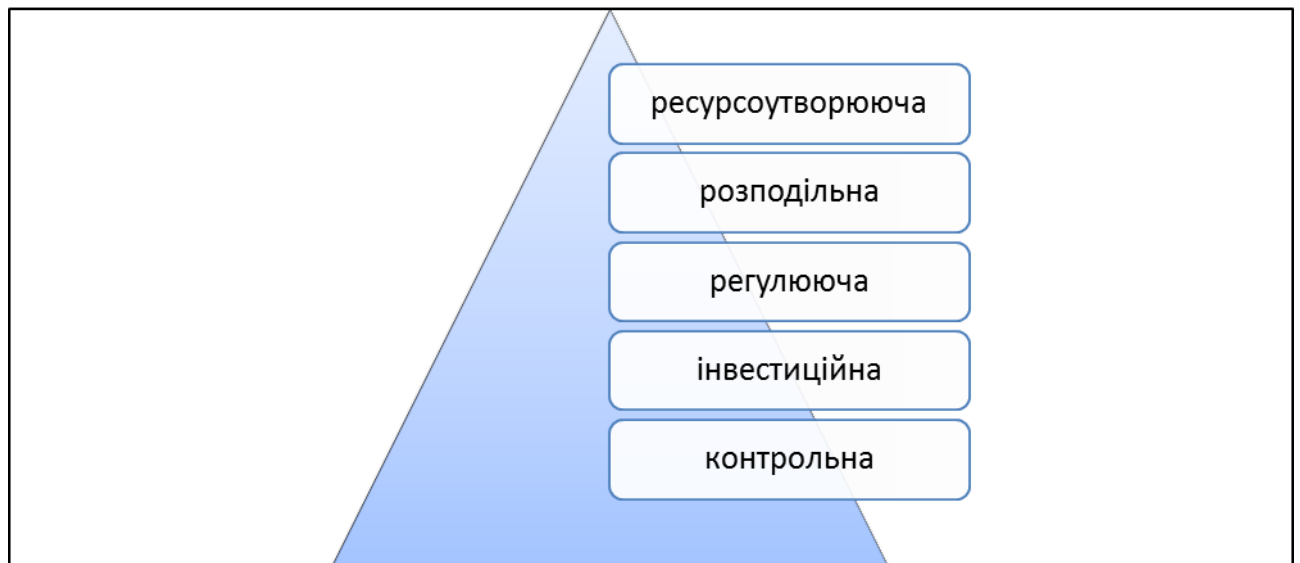
Рис. 2. Функції особистих фінансів в соціально-економічному ракурсі

При цьому, фінансові рішення про джерела доходу, про необхідність і метод формування грошових коштів, їх розмір і цільове призначення, час використання завжди приймаються самостійно фізичною особою. Таким чином, особисті фінанси завжди пов'язані з утворенням фінансових ресурсів через формування грошових доходів і фондів.