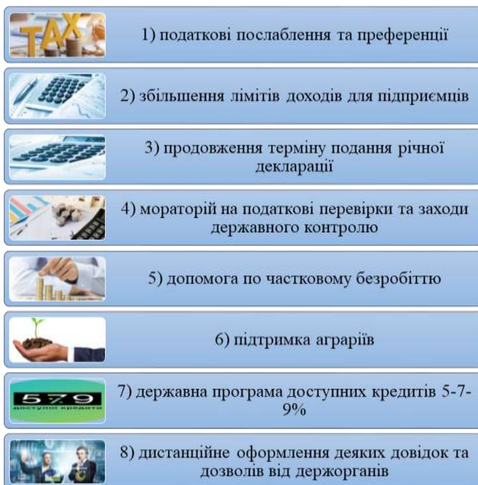
Рис. 3. Державні заходи підтримки МСБ та ФОП під час пандемії COVID-19