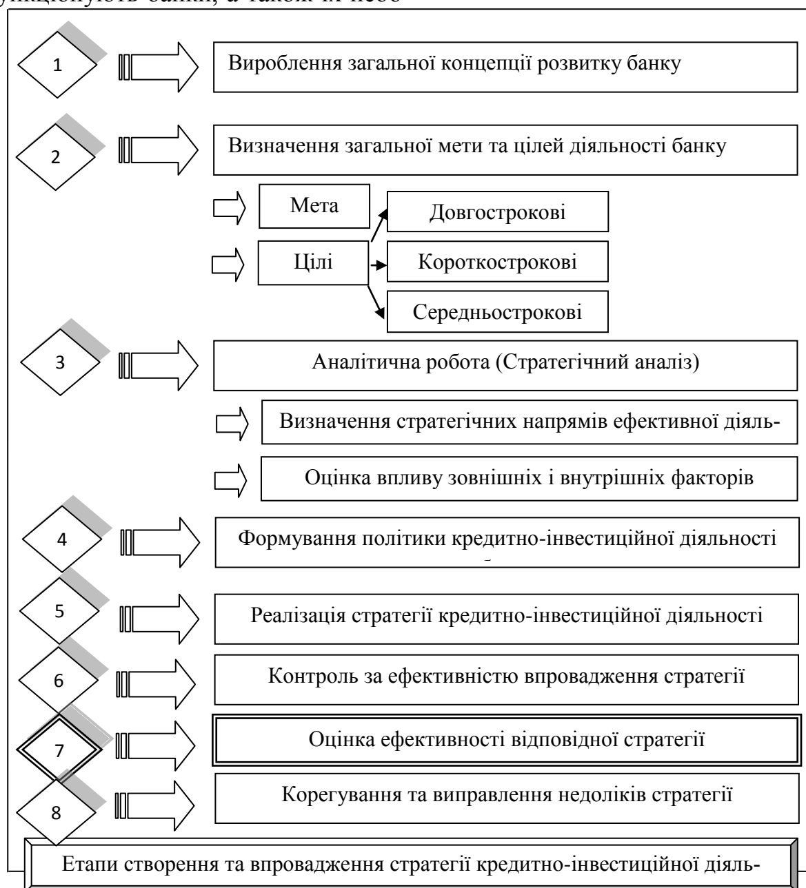
Рис.1 Процес формування та реалізації стратегій кредитно-інвестиційної діяльності банків

хідно враховувати під час прийняття управлінських рішень.