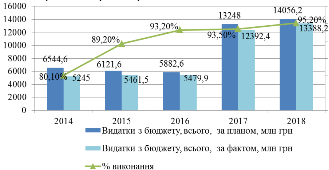
Рис. 3. Обсяги виконання плану державної підтримки сільського господарства з бюджету

теризується недофінансуванням, адже фактичні видатки з підтримки аграрного сектору кожного року відстають від запланованих. Тобто динаміка рівня фінансування державних програм свідчить, що вони в аналізованій період не реалізовані в повному обсязі.