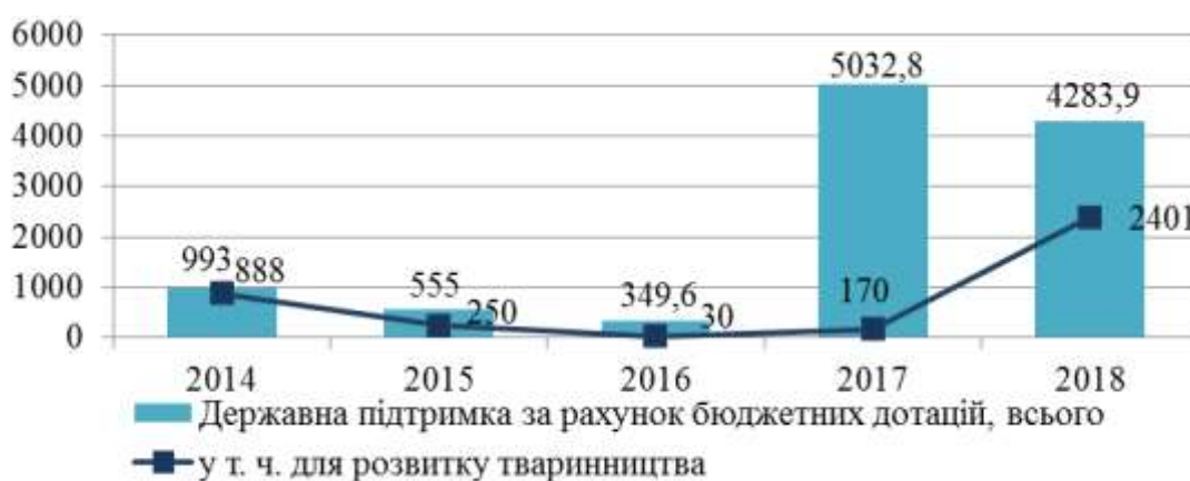
Рис. 5. Динаміка державної фінансової підтримки за рахунок дотацій, млн грн

коштів не відбувається належним чином. Відповідно, і результативність такої фінансової підтримки мало відчутна на показниках фінансово-господарської діяльності. Так, наприклад, за даними статистичної звітності рівень рентабельності всієї діяльності сільськогосподарських товаровиробників з 2015 р. по 2018 р. знизився фактично в 8,7 разів (з 30,4 % до 3,5 %) [10].