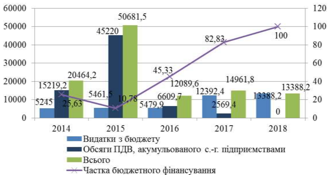
Рис. 2. Динаміка обсягів державної фінансової підтримки сільського господарства протягом 2014-2018 років, млн грн

Якщо бюджетне фінансування здійснює прямий вплив на діяльність сільськогосподарських підприємств, то опосередкований вплив пов'язаний здебільшого із застосуванням пільгового оподаткування. Проаналізуємо динаміку всієї прямої та опосередкованої державної фінансової підтримки сільського господарства, яка представлена на рис. 2.