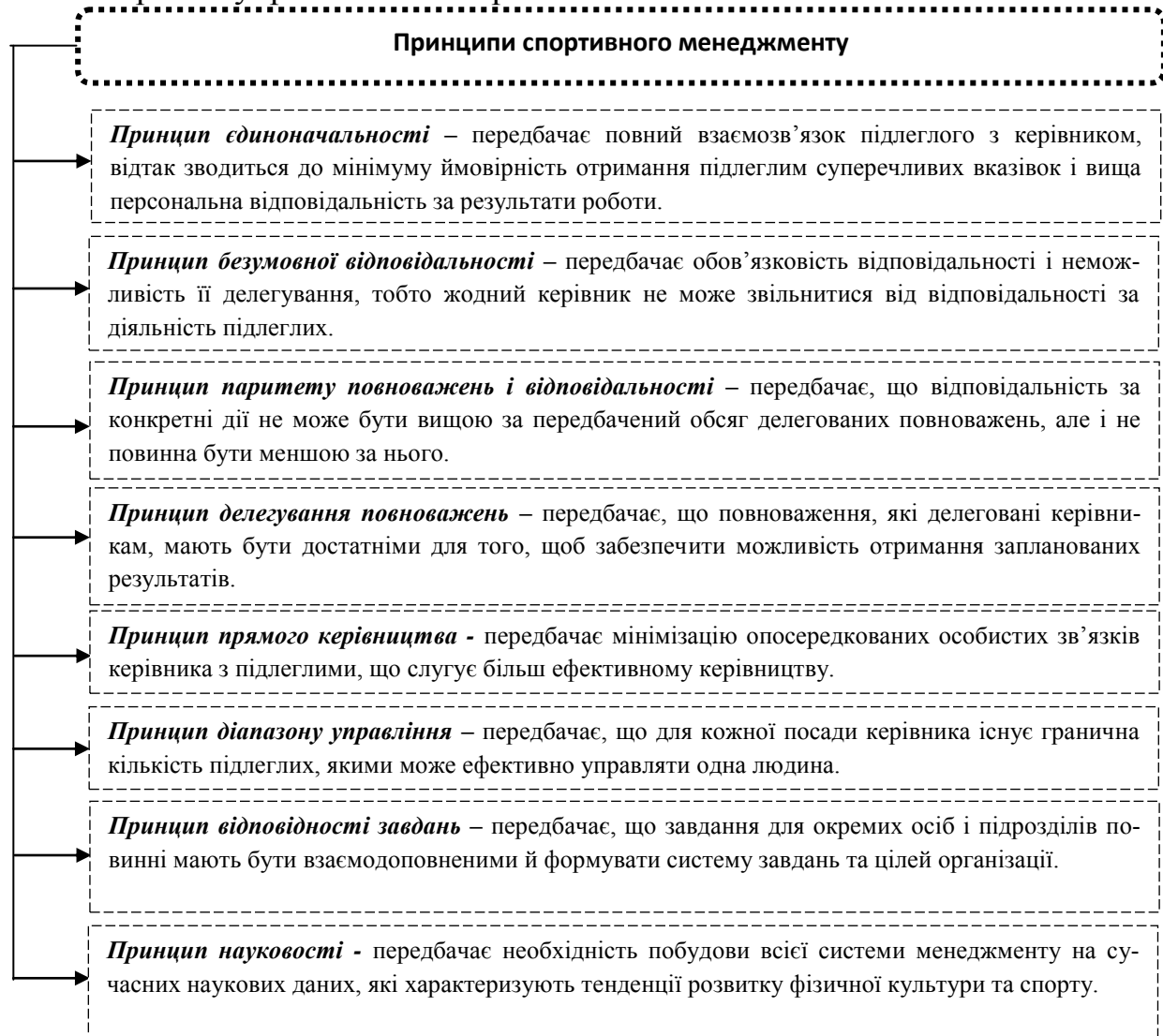
Рис. 1. Принципи спортивного менеджменту

ням певних принципів. Вони являють собою основні правила, положення та норми поведінки, якими мають керуватися органи управління та окремі працівники в процесі здійснення своєї діяльності (рис.1).