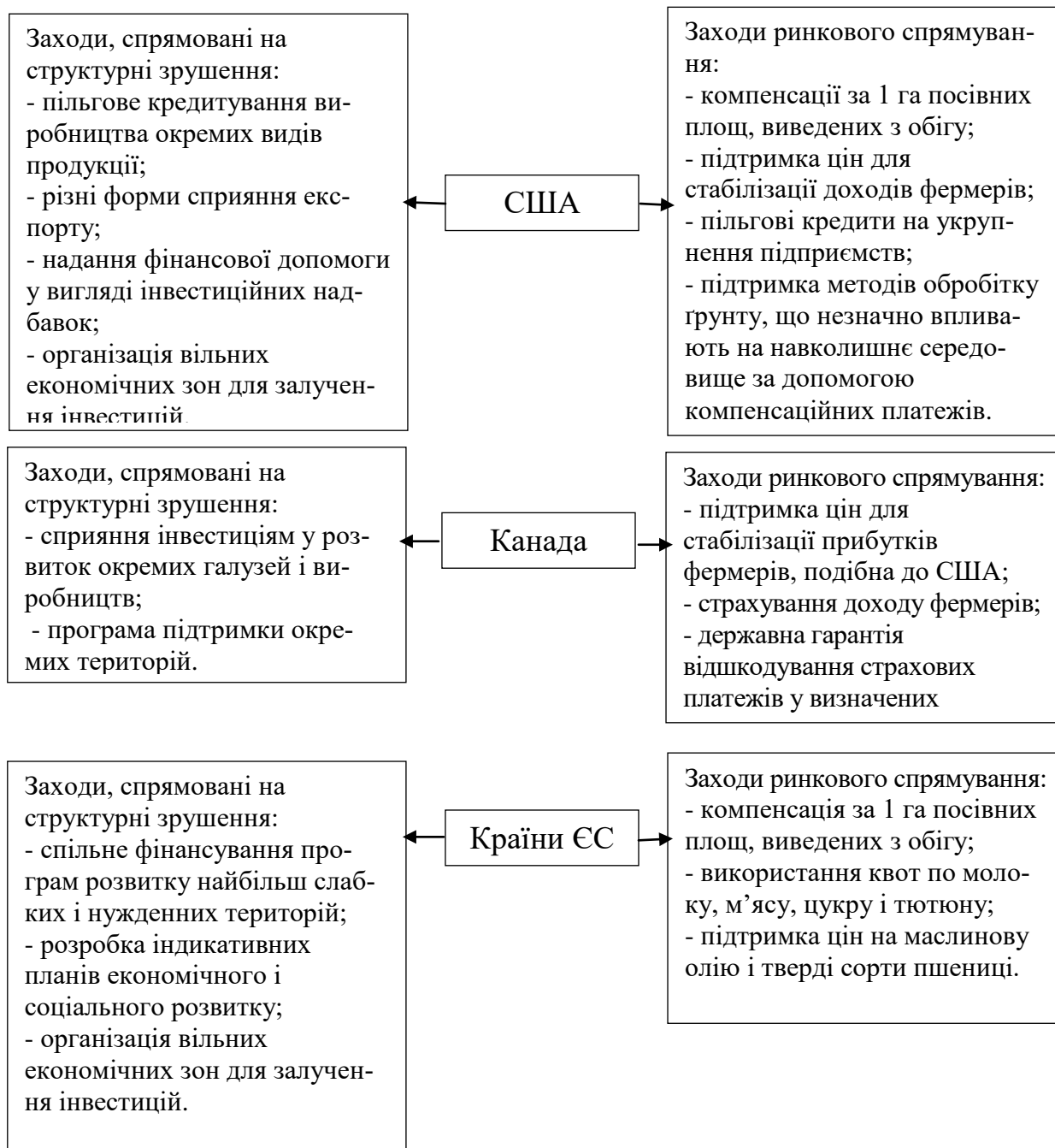
Рис. 3. Основні заходи державного регулювання аграрного сектора економіки США, Канади та країн ЄС

Отже, головним елементом фінансового механізму в країнах з розвинутою економікою є регулювання цін на продукцію сільського господарства державою. А саме встановлення мінімального граничного рівня для ринкових цін, нижче якого вони не можуть