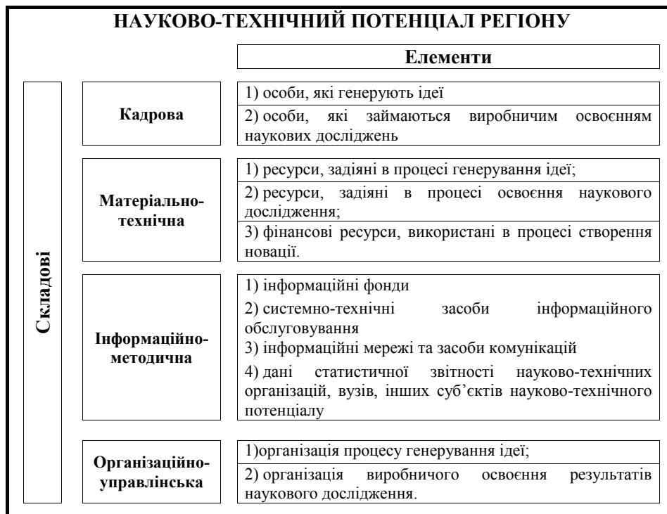
Рис. 1. Структурні елементи науково-технічного потенціалу регіону

Науково-технічний потенціал регіону базується, з одного боку, на власних складових (рис. 1): кадровий, матеріально-технічний, інформаційно-методичний та організаційно-управлінській. З іншого, оскільки регіон слід розглядати як відкриту систему, яка має тісні науково-технологічні, економічні, інформаційні контакти з іншими регіонами країни та зарубіжжя, то він базується на кооперації та інших зв'язках з партнерами щодо створення новацій за угодами, чи через механізм вільної торгівлі ноу-хау, ліцензіями та патентами.