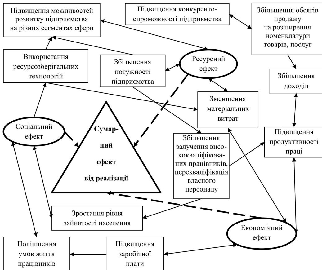
Рис. 1. Схема взаємозв'язку складових сумарного ефекту від реалізації стратегії фінансової безпеки підприємства

Між усіма складовими сумарного ефекту від упровадження стратегії фінансової безпеки є взаємозв'язок (рис. 1). Так, наприклад, від використання ресурсозберігальних технологій за рахунок зменшення матеріальних витрат підвищується можливість розвитку підприємства на різних сегментах сфери шляхом збільшення обсягів продажу продукції, товарів, послуг за зниженими цінами, тим самим підвищуючи конкурентоспроможність підприємства.