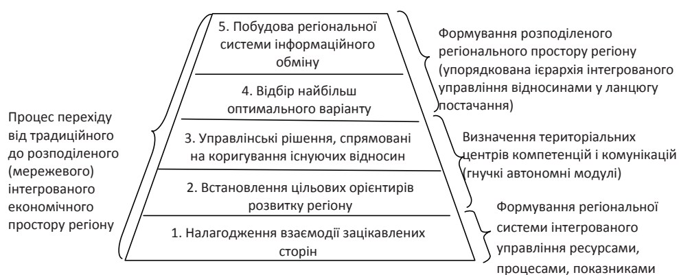
Рис. 1. Структура процесу формування ланцюга постачання регіону

д) побудова регіональної системи інформаційного обміну на трьох базових рівнях: підсистема інноваційно-технологічної комунікації; підсистема координації взаємодії елементів РЛП (територіальні логістичні вузли і центри комунікацій); підсистема формування «ядра» ланцюга постачання.