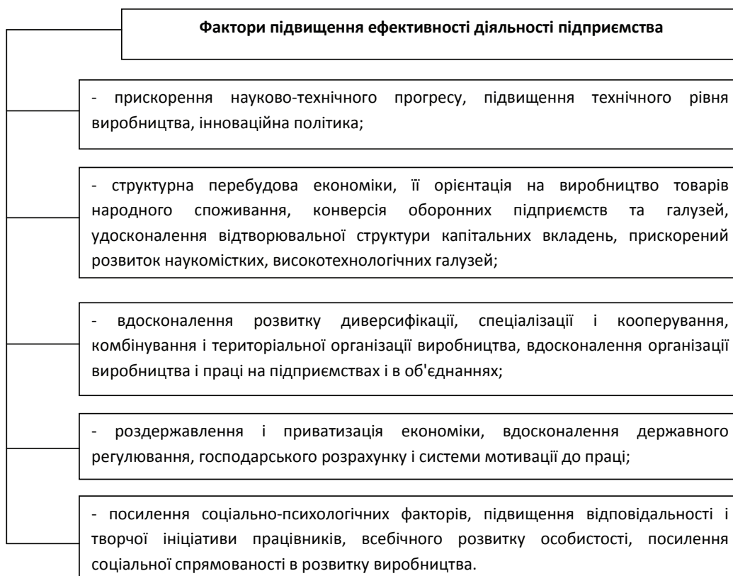
Рис. 1. Базові фактори підвищення ефективності діяльності підприємства на інноваційних засадах*

Найважливіше значення щодо зростання економічної ефективності виробництва надається раціональному використанню виробничого потенціалу, максимальному скороченню втрат та режиму економії ресурсів.