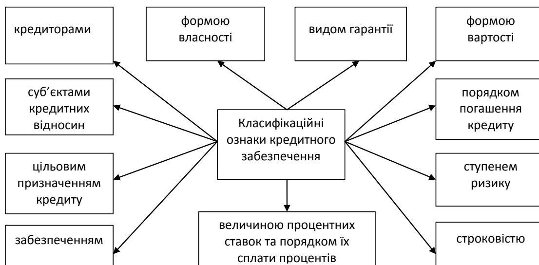
Рис. 2. Класифікаційні ознаки кредитного забезпечення відтворення основних засобів сільськогосподарських підприємств