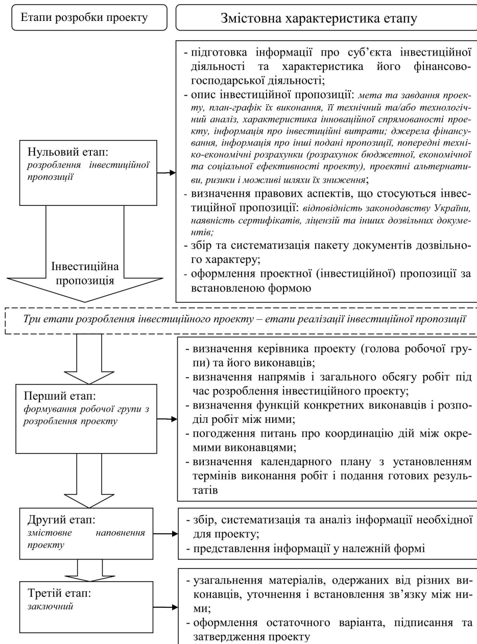
Рис. 3. Етапи розробки інвестиційного проекту, для реалізації якого може надаватися державна підтримка та їх змістова характеристика

Фінансування та співфінансування розробки та реалізації інвестиційного проекту здійснюється виключно за рахунок коштів державного та/або місцевих бюджетів. Кредитування та повна або часткова компенсація відсотків за кредитами здійснюється також за рахунок коштів державного та/або місцевих бюджетів, але виключно в рамках реалізації інвестиційного проекту. На етапі реалізації інвестиційного проекту з метою забезпечення виконання боргових зобов'язань за запозиченнями суб'єкта господарювання та кредитування за рахунок коштів державного або