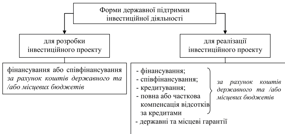
Рис. 2. Форми державної підтримки розробки і реалізації інвестиційних проектів [6]

Кожна з вказаних форм державної підтримки передбачає застосування певних інструментів державної підтримки інвестиційної діяльності, що є предметом подальшого дослідження.