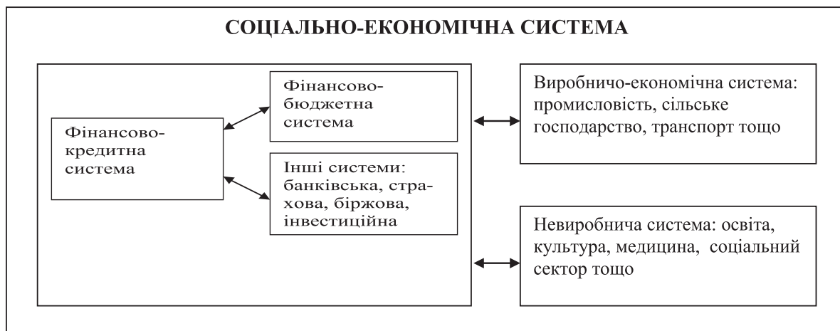
Рис. 2. Схема взаємодії економічних систем різних рівнів

Фінансово-кредитна система тісно взаємодіє з зовнішнім середовищем як єдине ціле, одночасно виступаючи підсистемою соціально-економічної системи, що визначає її функціонування в межах існуючого законодавства та дотримання єдиних юридичних норм (рис. 2).