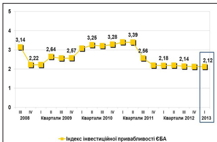
Рис. 2. Індекс інвестиційної привабливості України за даними Європейської бізнес асоціації [8]

Так за даними Європейської бізнес асоціації бізнесмени відзначають посилення тиску на бізнес, корупція, неможливість захисту прав у суді та інші недоліки. Міжнародні бізнесмени все частіше говорять про неможливість чесно працювати в Україні та у перспективі наголошують про припинення діяльності.